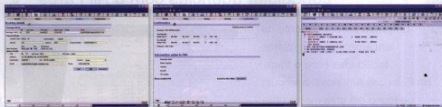
Tela do Amadeus Multi Content Web Services de Airgum